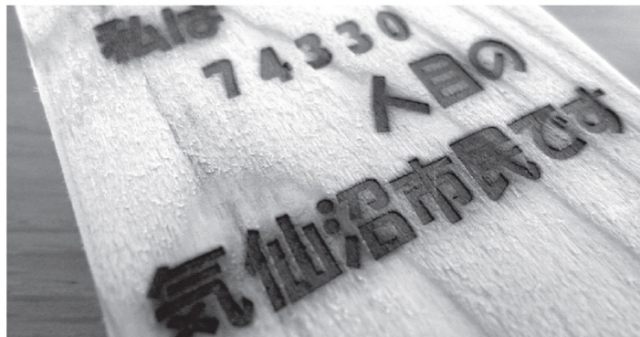
〈気仙沼ファンクラブ会員証〉

東日本大震災の復興支援活動のご縁から、平成23年3月11日の気仙沼市民数74,247人の次の74,248人から刻印された会員証をいただきました。