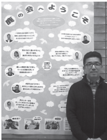
<手話サークル鹿の会で活動中>

平成25年9月鳥取県が「手話言語条例」を成立させました。これは、ろう者の大切なコミュニケーション手段である「手話」が「公用語」として認められた瞬間でした。