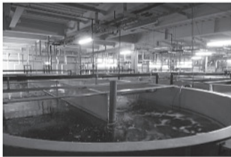
<養殖場全景(手前はアナゴの水槽)>