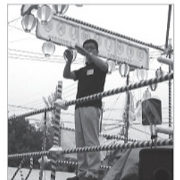
<やぐらの上で通訳>

平成26年8月2日、奈良市総合福祉センターで行われた「第30回ふれあい盆踊り大会」で、手話通訳ボランティアとして参加し、開会から閉会まで手話通訳をしました。手話初心者の私にとってはたいへん困難なことでしたが、サークルの方々に教えていただいたり、励ましていただき、無事デビューを果たすことができました。