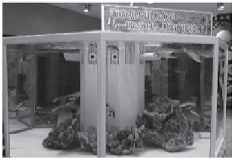
<岡山駅前の展示水槽(海水魚と淡水魚が同居)>

(※1)「好適環境水」…岡山理科大学 山本俊政准教授が中心となって開発。海水の中から魚類に必要な成分をナトリウム・カリウム・カルシウム等に絞込み、浸透調節を可能にした機能水。